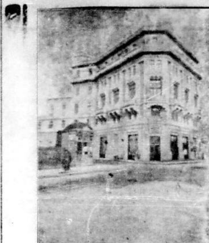
Palatul Camerei de Comerț

S'a luat deasemenea dispoziția ca garnitura de port să se atașeze la trenurile de mai sus în zilele fixate.