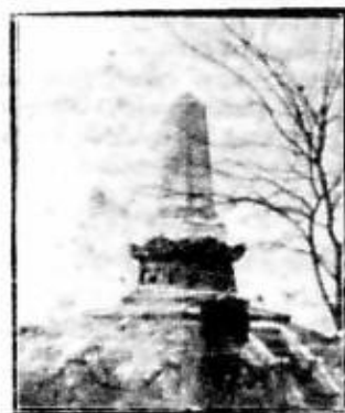
Monumentul eroilor francezi